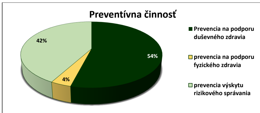
Graf č. 2 Preventívne aktivity zrealizované so žiakmi v ZŠ a SŠ podľa zamerania

Napriek obmedzeným personálnym kapacitám sa podarilo úspešne zrealizovať celkovo 500 hodín preventívnych aktivít v školskom prostredí, ktorých sa zúčastnilo 9866 žiakov ZŠ a SŠ. Podrobný prehľad realizovaných aktivít je uvedený v tabuľke č. 4, pričom ich vizuálne spracovanie je dostupné v grafoch č. 2 a 3.